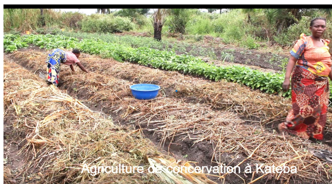
Agriculture de conservation à Kateba

A travers le projet 'Renforcement de la durabilité des systèmes alimentaires dans les exploitations familiales à travers les innovations agro écologiques' - Agro-écologie, la Caritas Développement Kongolo (CDK) a initié les exploitants agricoles cibles à la "technique d'agriculture de conservation". Cette dernière offre comme avantages la conservation de la fertilité du sol, la production en toute saison et une bonne récolte. Cette technique repose